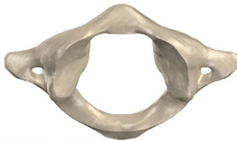
De eerste cervicaalwervel genoemd 'atlas'

Door het op de juiste plaats komen van je atlas kan er veel op de juiste plaats komen in je leven.